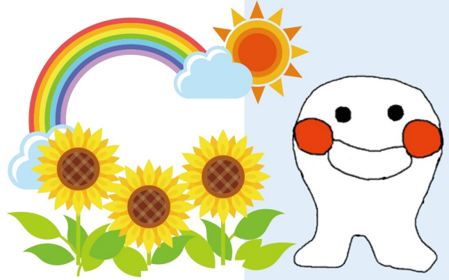
第58回名古屋市障害者作品展示会