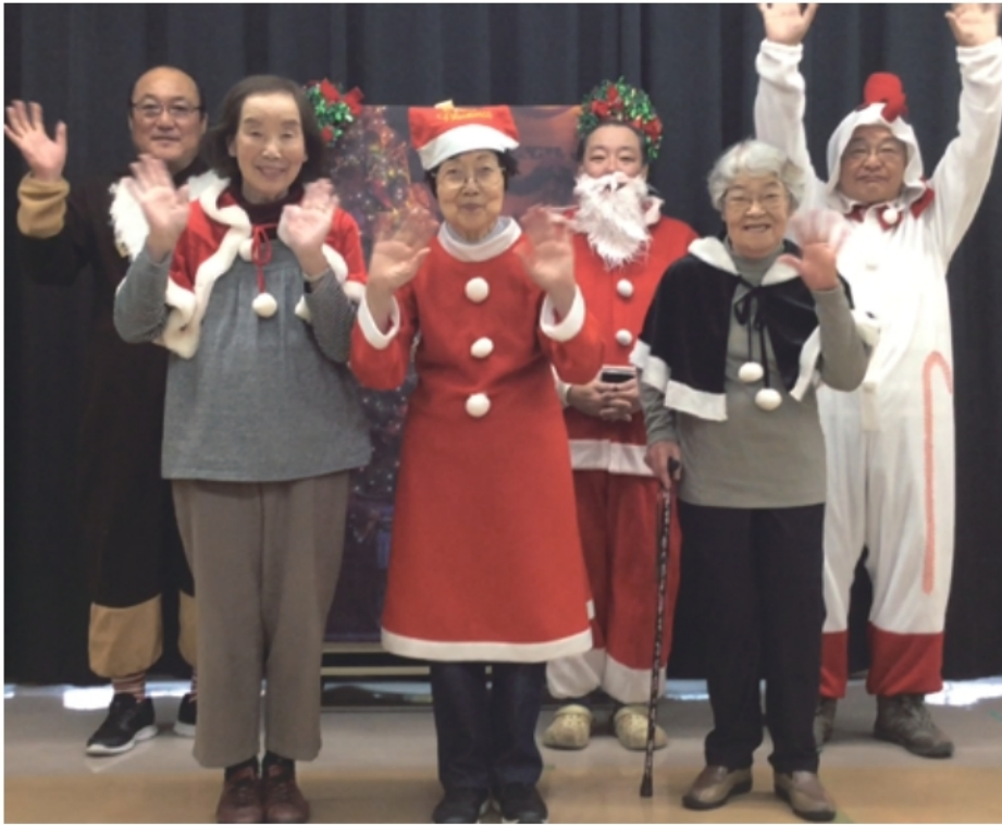
家族会役員の皆さん