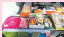
たくさんの作品を出しました