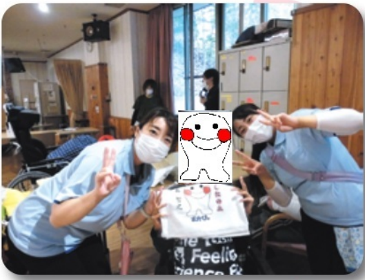
景品をもらったよ♪