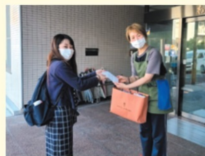
名城大学ボランティア協議会の学生さんと